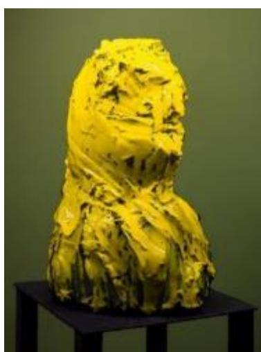
Sculpture de Marc Simon