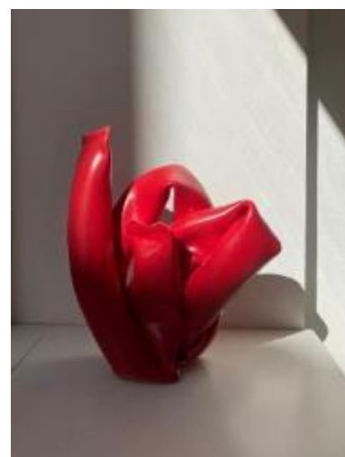
Sculpture d'Arlette Simon