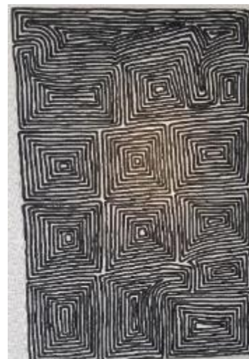
Oeuvre de Ronnie Tjampitjinpa

L'exposition « Sur terre ... vers les étoiles » célèbre la virtuosité et le dynamisme de ces artistes issus du pays continent.